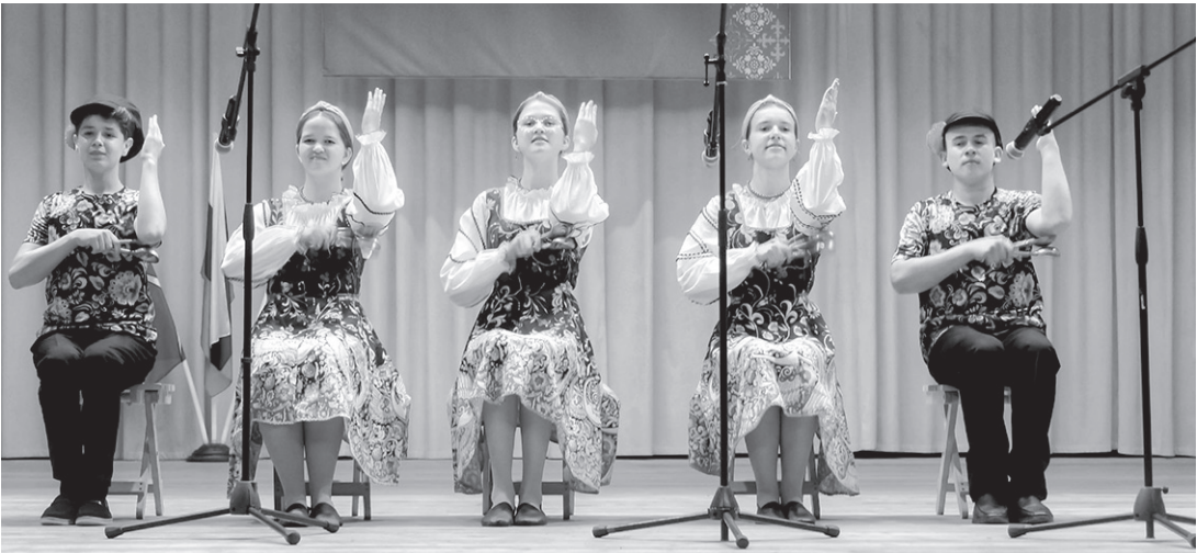
Выступления юных артистов были яркими и запоминающимися