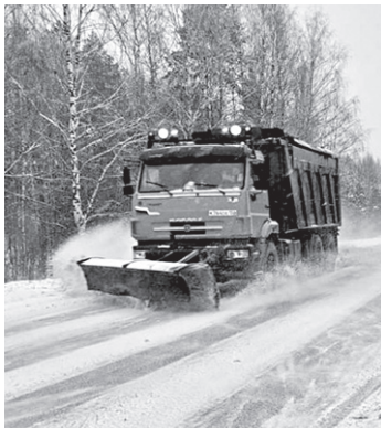
Не за горами зима

Диспетчерская служба ФКУ Упрдор «Кавказ» работает в круглосуточном режиме. По всем вопросам, возникшим во время следования по федеральным автодорогам, обращайтесь по телефонам диспетчерской службы: 8(879-3)333-11-59, 8(962)413-80-74